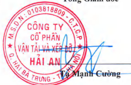
Tạ Mạnh Cường