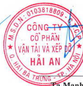
Tạ Mạnh Cường